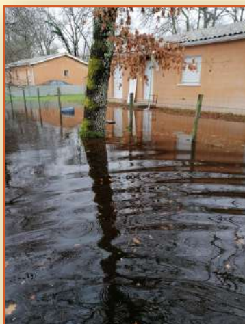
Inondation de mai 2020